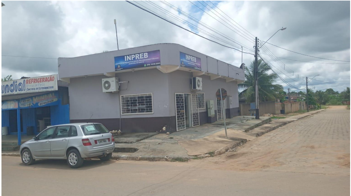
Atual sede administrativa do INPREB- (locação).